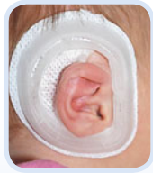
Anlegen des EarWell™-Systems ...