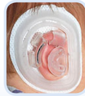
... an das Ohr des Säuglings